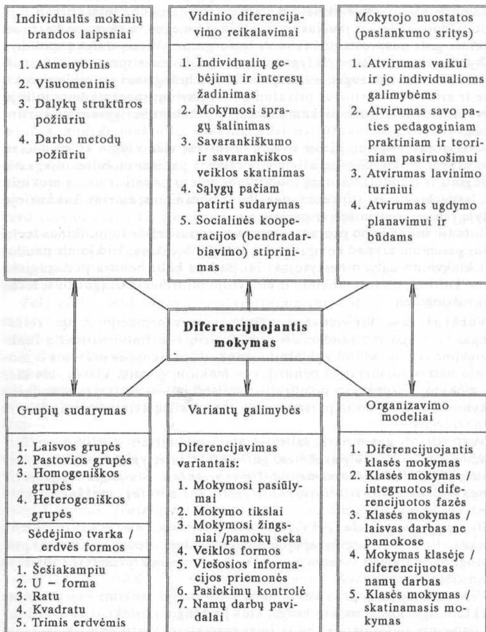
2 LENTELĖ. Diferencijuoto mokymo planavimo pavyzdys 1