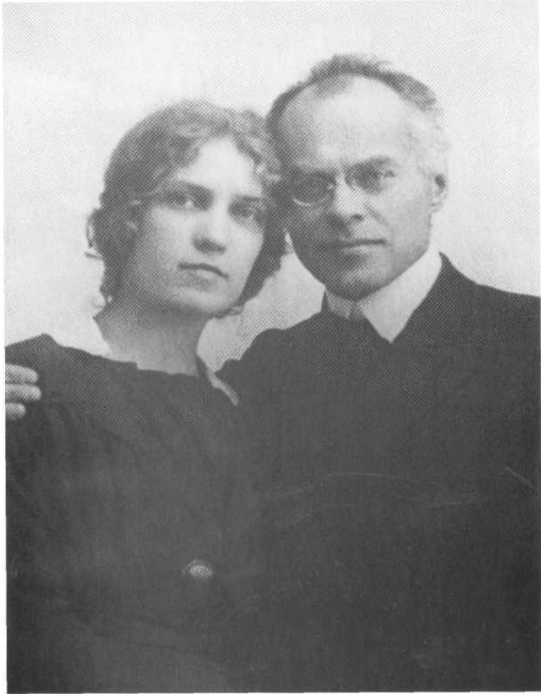
8. Augustinas Janulaitis su žmona Elena Jurašaitė apie 1916 m.