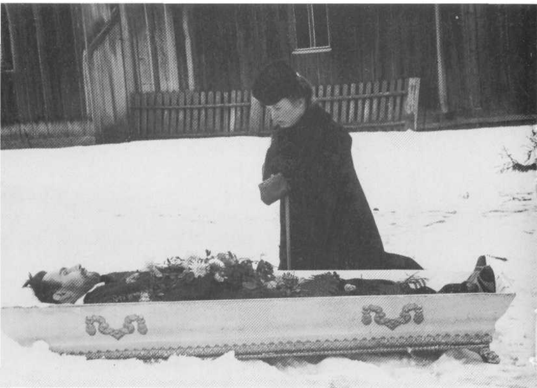
5. Zakopanėje 1907 12 08, prieš išlydint.