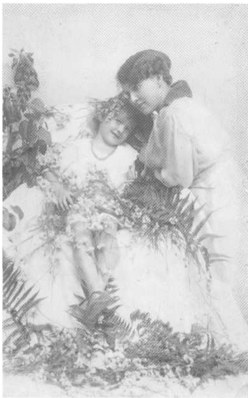
14. Motinystės džiaugsmas.