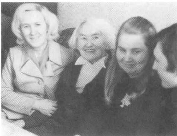
25. Mokiniai su mokytoja lanko Mamulę.